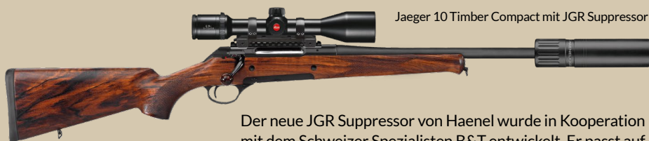
Jaeger 10 Timber Compact mit JGR Suppressor

Der neue JGR Suppressor von Haenel wurde in Kooperation mit dem Schweizer Spezialisten B&T entwickelt. Er passt auf jeden Lauf mit Mündungsgewinde M15x1. Nachweislich reduziert der Suppressor den Spitzenschalldruck des Mündungsknalls um mindestens 30 dB(C) und hält 30 Schuss in Folge im Schießkino stand.*